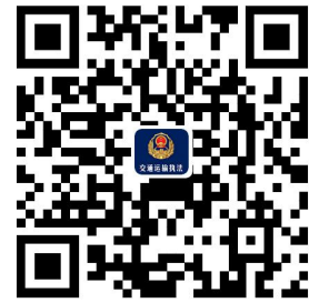
容缺办理事项清单