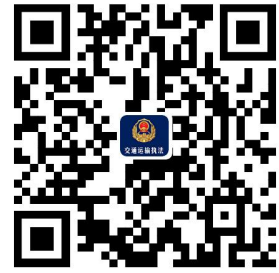
违规禁办事项清单