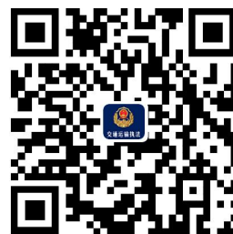
交通运输权力事项清单